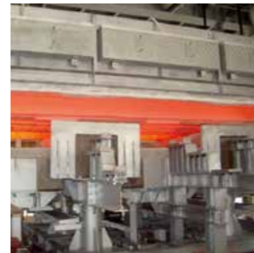
WB式鋳塊電気式加熱炉 常用温度：1000℃ (max1050℃) 炉内寸法：1020W×4500L×550H