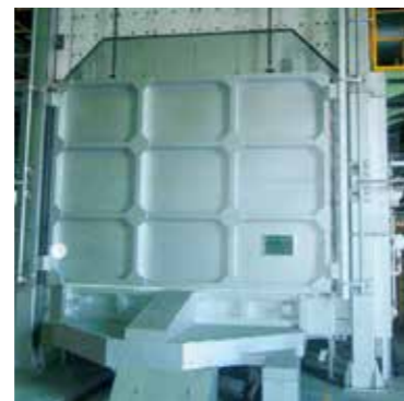
120トン除冷炉 加熱温度：600℃ (MAX800℃) 炉内温度分布：±15℃ 炉内有効寸法：2850W×7600L×1800H