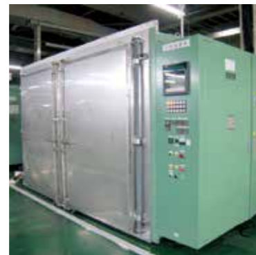
熱風循環式乾燥炉 常用温度：250℃ 炉内温度分布：±2.5℃ 炉内有効寸法：2800W×2500L×1700H