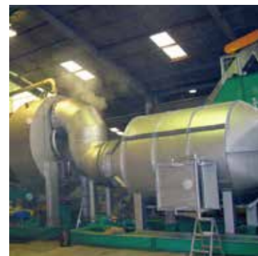
木屑炭化装置 キルン寸法：φ1760×7500L 炭化能力：木チップ 500kg/hr