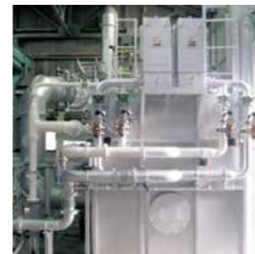
高性能鍛造炉 リジェネレータ：291KW×2台 加熱温度：1300℃ 炉内温度分布：±15℃ 炉内有効寸法：1500W×1500L×1200H